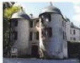
Le château d'Urtubie et ses tours de guet.