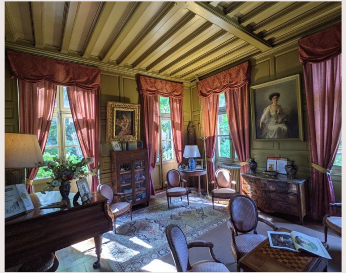
LE PETIT SALON