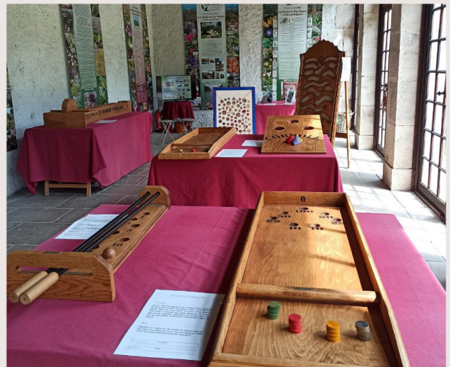
JEUX EN BOIS