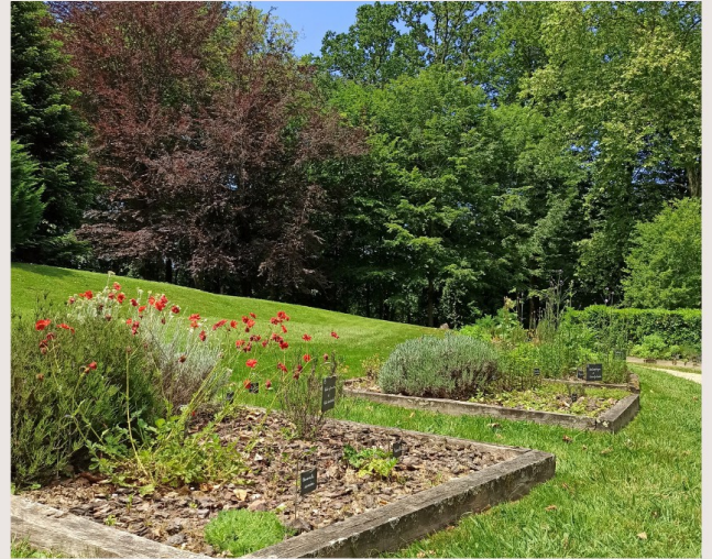
CARRÉ DES SIMPLES