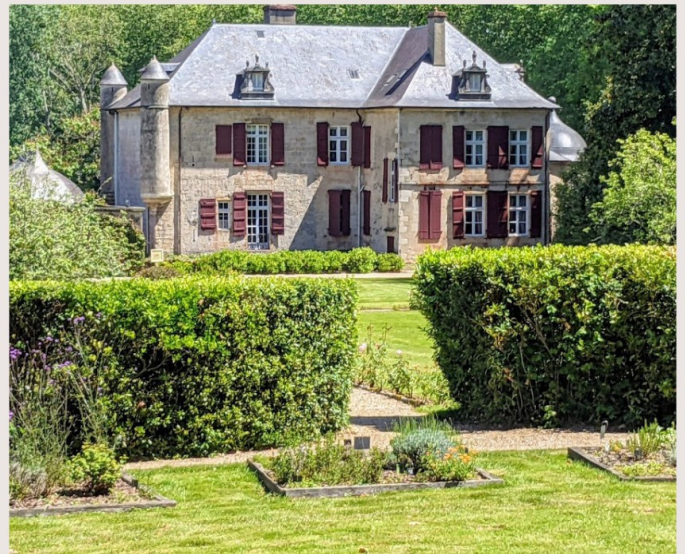
LE CHÂTEAU ET SON PARC