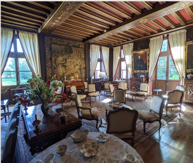
LE GRAND SALON