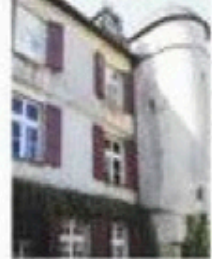
Le château d'Urtubie, un lieu chargé d'histoire.

Les murs du château d'Urtubie ont une histoire qui précède de plusieurs siècles celle de son propriétaire actuel.